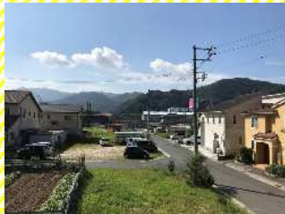
リビングからの風景