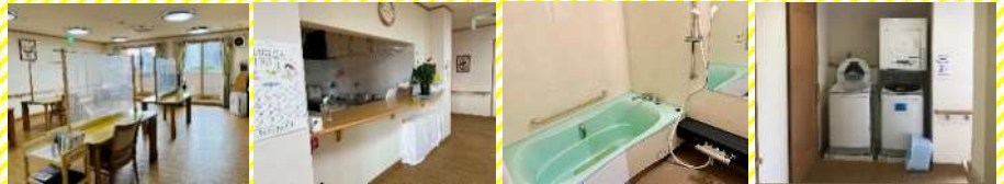
食堂(ピザがダイニング)