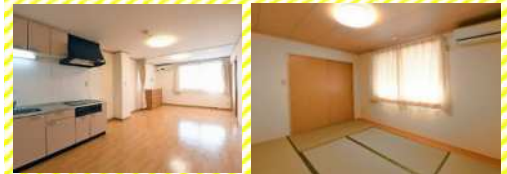
4F 居室 ダイニング