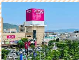
徒歩圏内にある大型商業施設