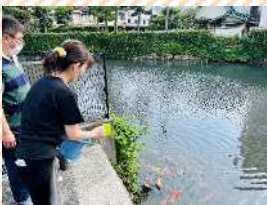
隣接する船入槽の堀に泳ぐ鯉